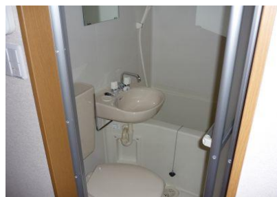
内装写真は別の部屋のものです。