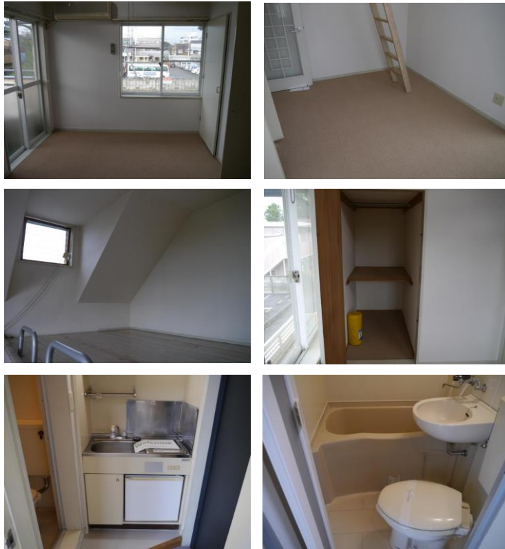
内装写真は別の部屋の物です。