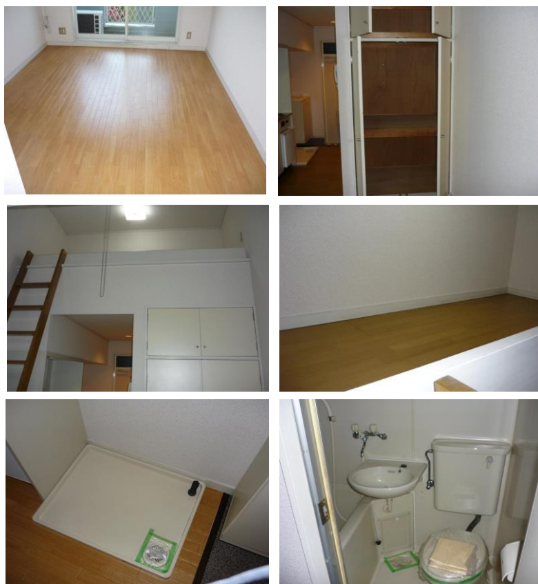
※内装写真は別の部屋のものです。