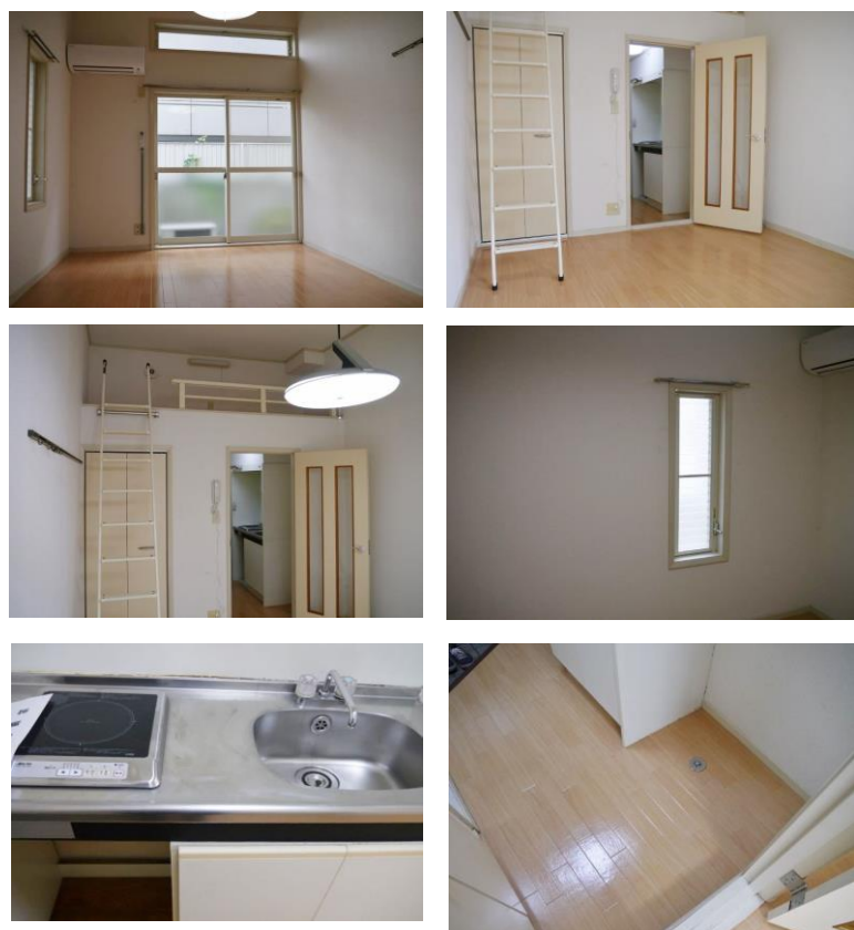
内装写真は別の部屋のものです。