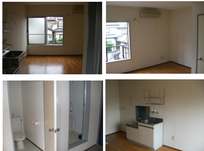
※内装写真は別の部屋のものです。