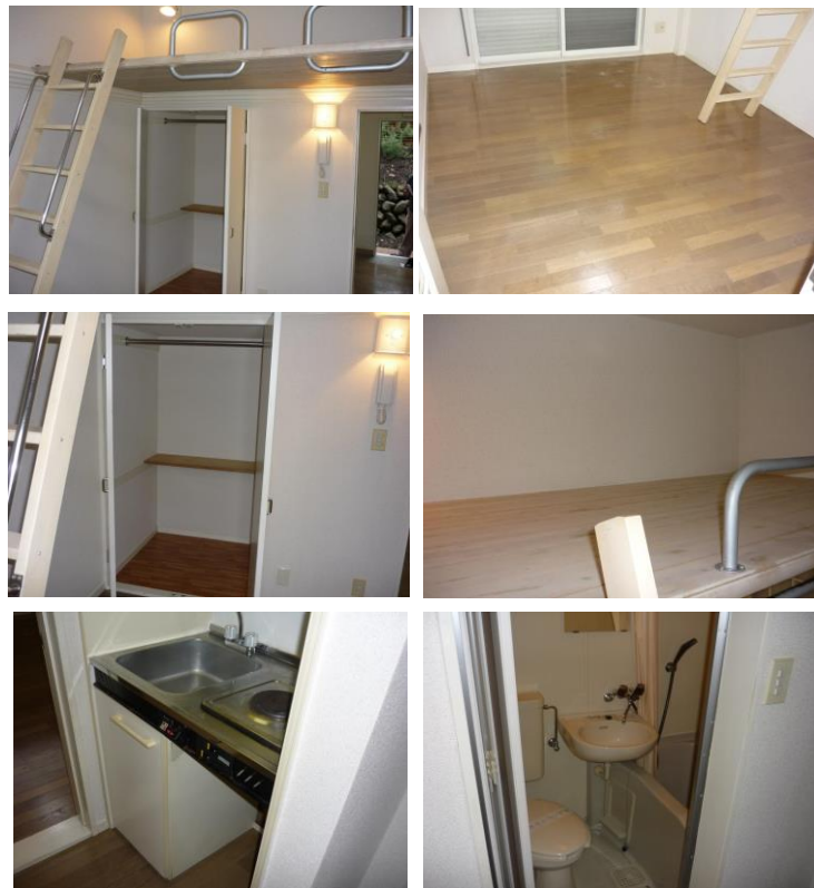
※内装写真は別の部屋のものです。